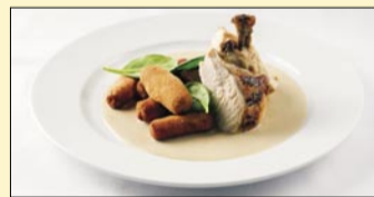
Sous vide kuřecí supreme s omáčkou z modrého sýra, smažené dýňové krokety.

Přijďte ochutnat! Váš Team Gourmet restaurant a Catering